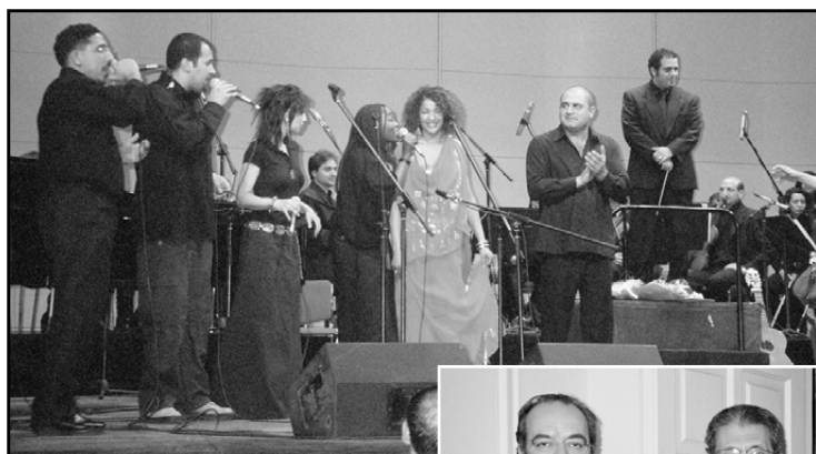
In alto: un momento del concerto

Gli Imazighen sono gli uomini liberi che le popolazioni del Nord hanno chiamato Barbari/Berberi; il nome che un popolo si assegna