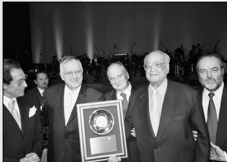
Un momento della cerimonia del Premio

Il Premio gli è stato conferito "per la grande opera di comunicazione e dialogo interculturale svolta sia come giornalista che nell'attuale veste di Presidente del Consiglio della Biblioteca del Grande Cairo". Presenti alla cerimonia: il Ministro della Cultura egiziano Farouk Hosni, il Segretario generale della Maison de la Méditerranée Walter Schwimmer, l'Ambasciatore d'Italia al Cairo Antonio Badini, il presidente della Fondazione Laboratorio Mediterraneo Michele Capasso.