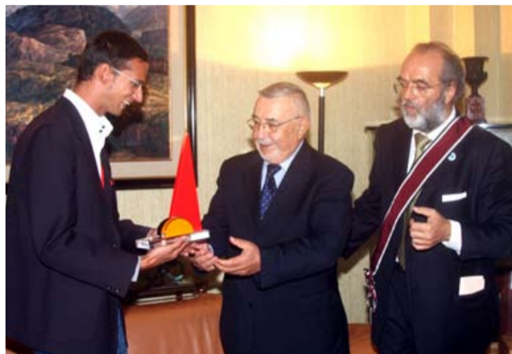
Jacopo Molinari dona l'opera "Totem della Pace" al Presidente del Parlamento del Marocco Abdelwahad Radi.

Condivido pienamente il messaggio di questo simbolo di pace. E questo insieme al popolo marocchino che è particolarmente legato alla pace e alla "pace nella giustizia". Io credo che l'azione intrapresa dalla Fondazione Mediterraneo con la diffusione del "Totem della Pace" di Molinari in tutto il mondo sia destinata ad avere un effetto molto positivo su tutta l'opinione