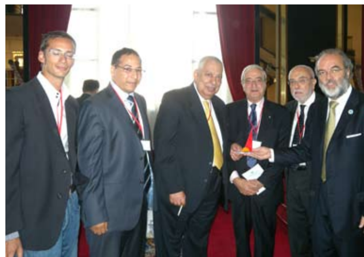
Consegna del "Totem della Pace" allo speaker del Consiglio Nazionale Palestinese Taysir Qu'ba.