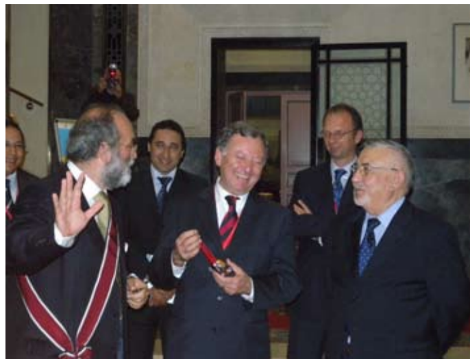
Il presidente Rudy Salles riceve in dono il "Totem della pace" a conclusione del suo mandato.