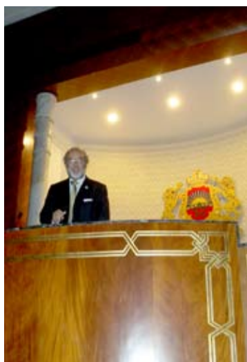
L'intervento del Presidente Capasso.