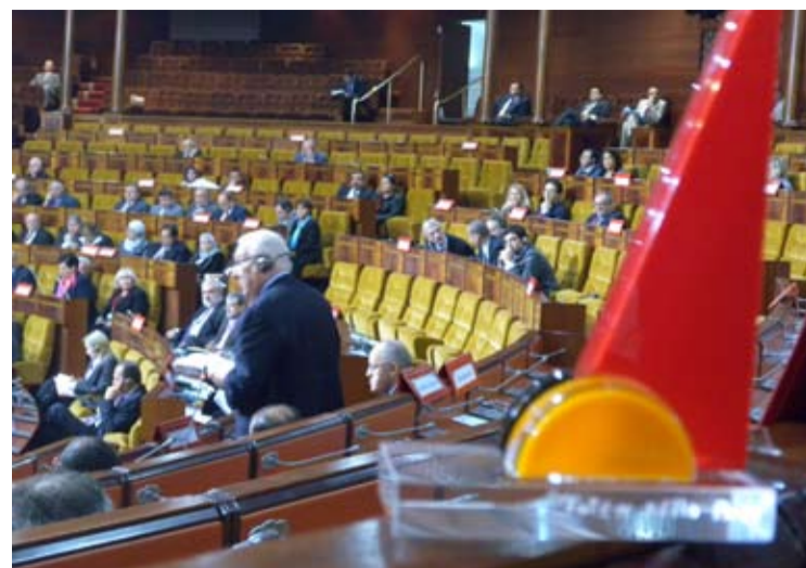
Il Presidente della Knesset, Reuven Rivlin, interviene all'Assemblea Parlamentare del Mediterraneo: in primo piano, il "Totem della Pace".