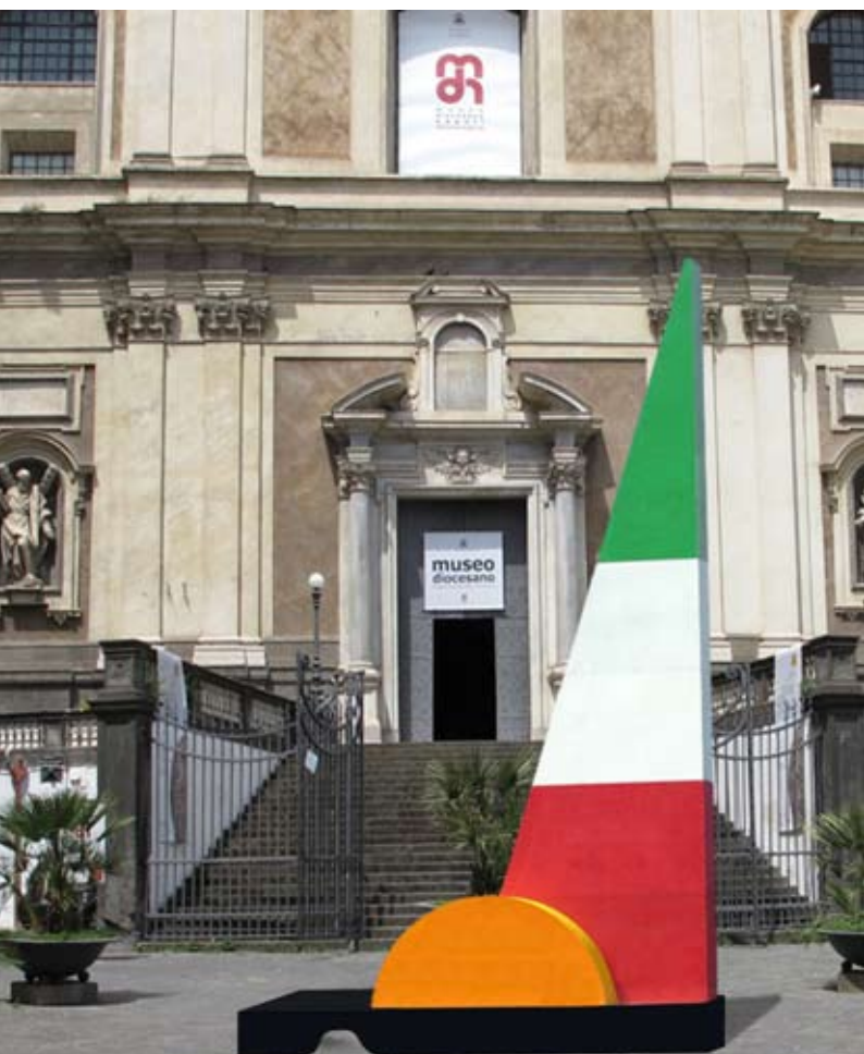
Il “Totem della Pace” dello scultore Mario Molinari all’ingresso del Museo Diocesano di Napoli

In questa occasione, in presenza di S.E. il Cardinale Crescenzio Sepe e di Rappresentanti di Istituzioni internazionali il Totem della Pace dello scultore Mario Molinari – un simbolo di dialogo che la Fondazione Mediterraneo sta diffondendo nelle principali città del mondo – sarà inaugurato nella sede della “Maison de la Paix” e all’ingresso del Museo Diocesano di Napoli, dove l’opera monumentale sarà “Tricolore” in occasione del 150° Anniversario dell’Unità d’Italia, ed altri. ( www.fondazionemediterraneo.org/Totem della Pace ).