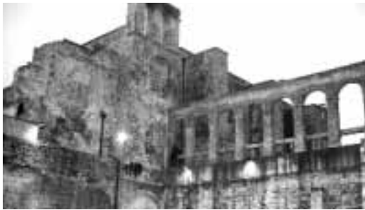
Vista della Sede assegnata nell'ex Convento degli Agostiniani

AREA TEMATICA: Educazione multiculturale