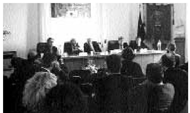
Un momento della cerimonia di insediamento della Sede