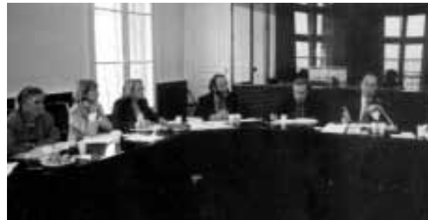
Una riunione preparatoria de "Les Assises de la Méditerranée"