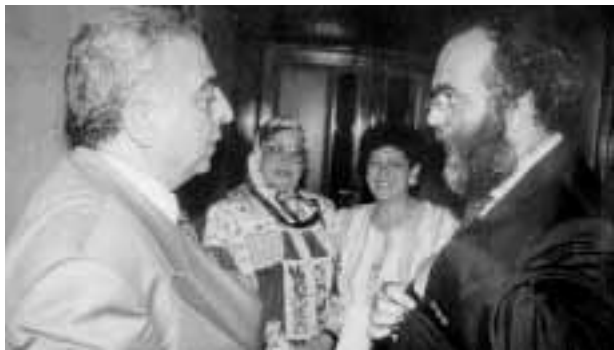
Alessandria, incontro tra il Direttore generale dell'Accademia e il Vice Ministro della Cultura Ghoneim