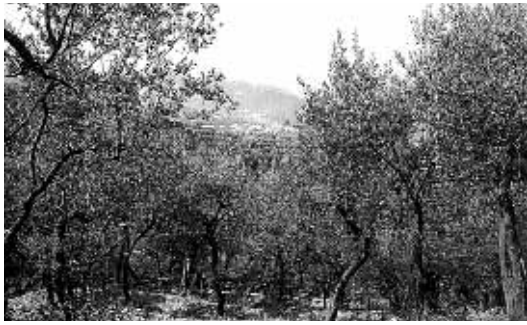
Uliveti di Larino