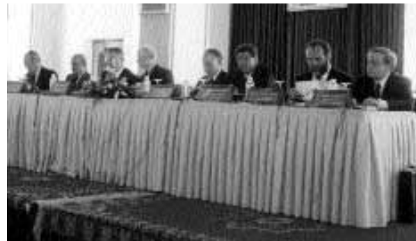
Marrakech, 24/4/1999. Riunione della Commissione Internazionale di sostegno dell'Accademia del Mediterraneo