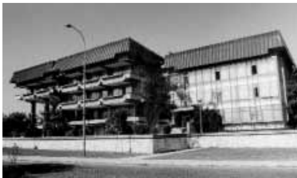
La Sede dell'Accademia Macedone a Skopje