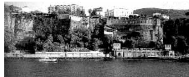
La Costiera sorrentina