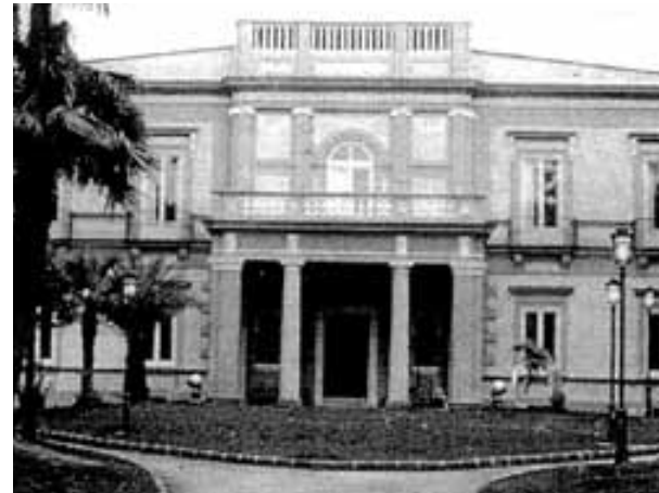
La villa Savonarola assegnata per la Sede dell'Accademia