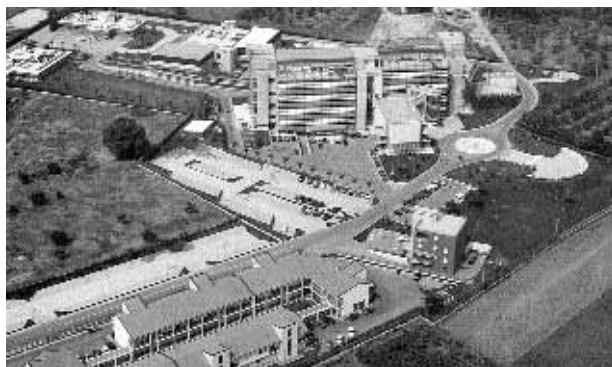
Veduta aerea della Sede