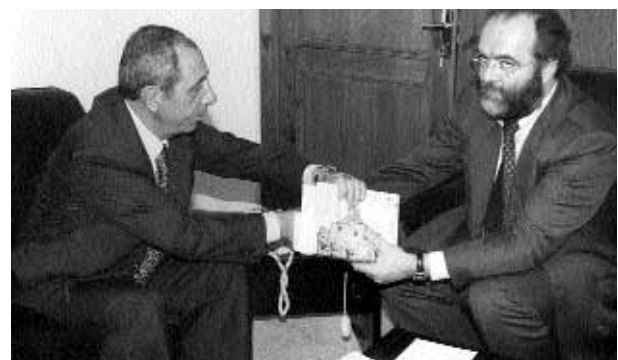
Amman, 9/11/1998. Il Ministro della Cultura Talal S. Al-Hasan e il Direttore Generale dell'Accademia sottoscrivono il protocollo d'intesa

diterraneo coadiuvata dalla Royal Society of Fine Arts. L'idea è quella di utilizzare lo strumento informatico in maniera complementare con le forme tradizionali dell'arte. Un festival verrà dedicato a queste nuove forme d'arte. Opere di donne artiste mediterranee saranno riunite in una serie di programmi per i circuiti televisivi euromediterranei.