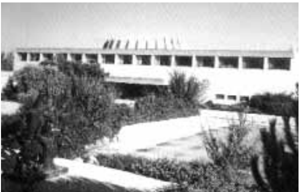
Vista esterna della Sede