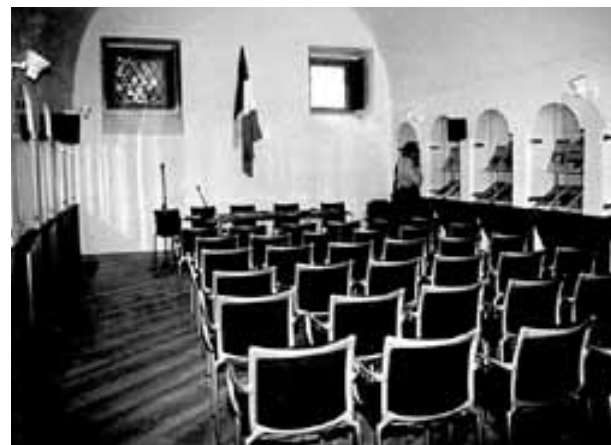
Vista interna della Sede