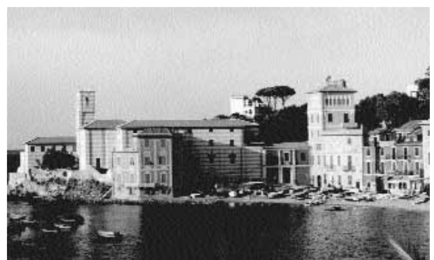
Vista esterna della Sede

OPERATIVITÀ: La Sede è allocata nell'ex Abbazia dei Padri Domenicani ed è stata inaugurata il 6 settembre 1999 alla presenza di rappresentanti del Governo del Marocco e delle autorità locali.