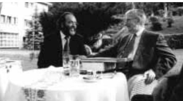
Skopje, 27/9/1999. Il Direttore generale dell'Accademia presenta il programma delle attività al Presidente della Repubblica di Macedonia Kiro Gligorov