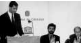
Barcellona, 30/11/1995 - Il principe Felipe de Borbone, il vice presidente della Commissione europea Marin ed il presidente della Generalitat di Catalogna Pujol inaugurano il 1° Forum Civile Euromed

OPERATIVITÀ: La Fondazione Laboratorio Mediterraneo ha sottoscritto un protocollo d'intesa con l'Institut Català de la Mediterrània.