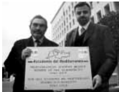
Roma, Farnesina 1° dicembre 1999 - Il Ministro macedone Popovski consegna la targa della Sede di Lipari