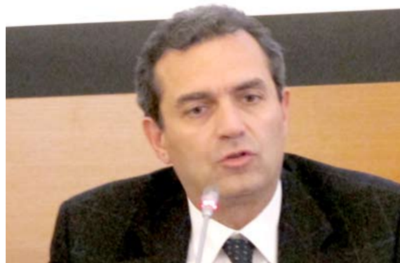
Luigi de Magistris