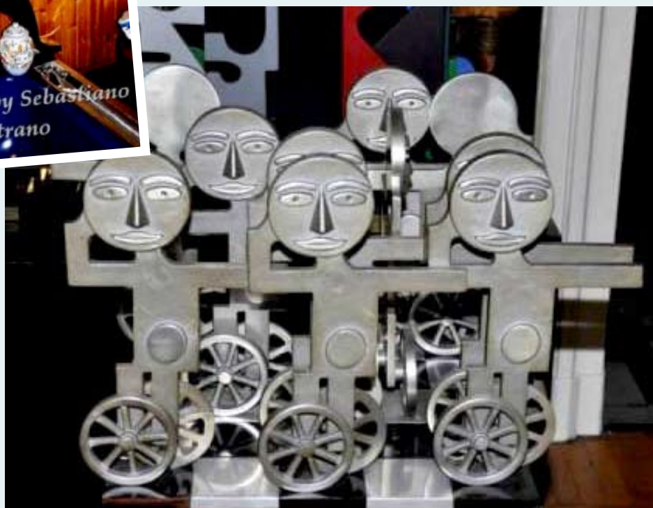
Nelle immagini: alcune opere esposte nella casa-museo di Mario Molinari