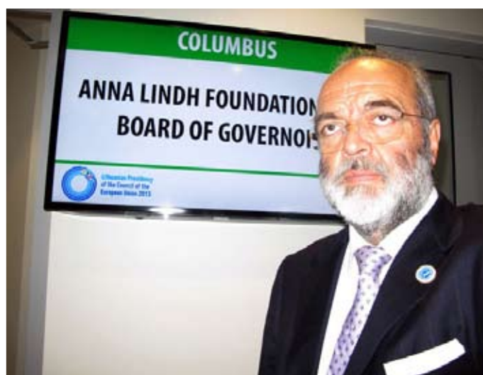
Alcune immagini della riunione