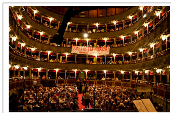
Immagine del Teatro Valle Occupato, unico finalista italiano al Premio Anna Lindh 2012

Questo è il link per vedere i 6 finalisti dell'Anna Lindh Dialogue Award 2012