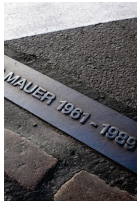
Luogo in cui crollò il muro di Berlino

Ne' le proteste occidentali e ne' un discorso famoso di Kennedy riuscirono a liberare Berlino. I leader occidentali non mancarono di denunciare la situazione , protestando vivamente, ma nei fatti intraprendere azioni concrete avrebbe voluto dire correre il rischio di una nuova guerra, cosa che nessuno voleva davvero. Del resto la Germania est , sostenuta dal blocco sovietico, aveva tutto il diritto di controllare il proprio settore di Berlino , limitando a proprio piacimento il traffico di persone alla frontiera. Nel 1963 il presidente americano Kennedy , in visita a Berlino Ovest , non mancò di rassicurare i berlinesi del fatto che gli Stati Uniti non li avrebbero abbandonati durante un famoso discorso in cui pronunciò la frase in tedesco ' Ich bin ein Berliner ' (io sono un berlinese).