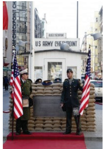
Il posto di blocco Checkpoint Charlie

Era possibile andare ad Ovest soltanto con un permesso. Non mancavano tuttavia i posti di blocco, il più famoso dei quali era il Checkpoint Charlie , da cui potevano passare tutti coloro che, per qualche motivo, ottenevano un permesso per recarsi ad Ovest: si trattava in gran parte di turisti e diplomatici, quasi mai di cittadini tedeschi.