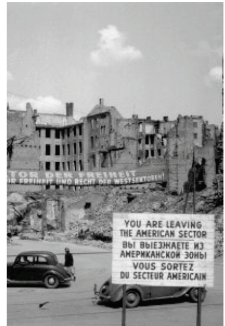
Blocco di Berlino 11 maggio 1949

Gli americani reagirono utilizzando un 'ponte aereo' per trasportare merci e persone.