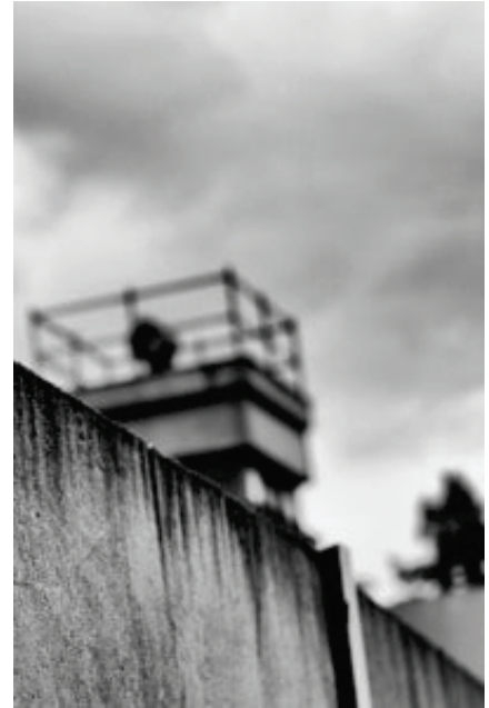
Sorveglianza del muro di Berlino

Non vanno tuttavia dimenticate le vittime del muro di Berlino : moltissimi tedeschi, circa 5000, vennero arrestati mentre tentavano di fuggire, mentre un numero imprecisato di persone (tra 150 e 250) persero la vita nel tentativo.