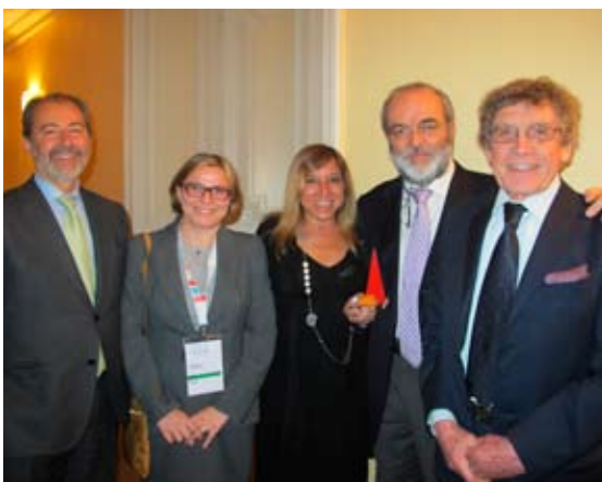
The Deputy Secretary General of the UfM Cardarelli and Plenipotentiary Minister Queirolo Palmas