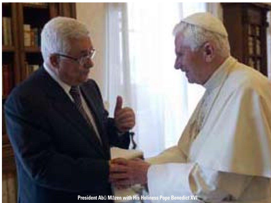
President Abū Māzen with His Holiness Pope Benedict XVI