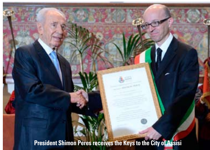
President Shimon Peres receives the Keys to the City of Assisi