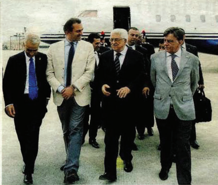
L'incontro Abu Mazen (il secondo da destra nella foto) accolto a Capodichino da Luigi de Magistris

Mahmud Abbas, meglio noto come Abu Mazen (letteralmente «Padre di Mazen», il suo primogenito morto per infarto), 78 anni, è il presidente dell'Autorità nazionale palestinese. È stato eletto il 9 gennaio del 2005, e ricopre la carica che prima era stata di Yaser Arafat e poi, ad interim, di Rawhi Fattuh. È il primo presidente palestinese nominato all'esito di elezioni: il suo mandato è scaduto nel 2009, ma Abu Mazen è tuttora in carica. Tra i fondatori di al-Fath, nel 1981 è divenuto membro dell'Olp. Ha partecipato ai colloqui di pace di Madrid e Oslo.