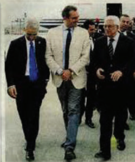
De Magistris con Abu Mazen. A PAGINA 5 Beneduce

Il rabbino capo: allibito. La sinistra: no, scelta giusta