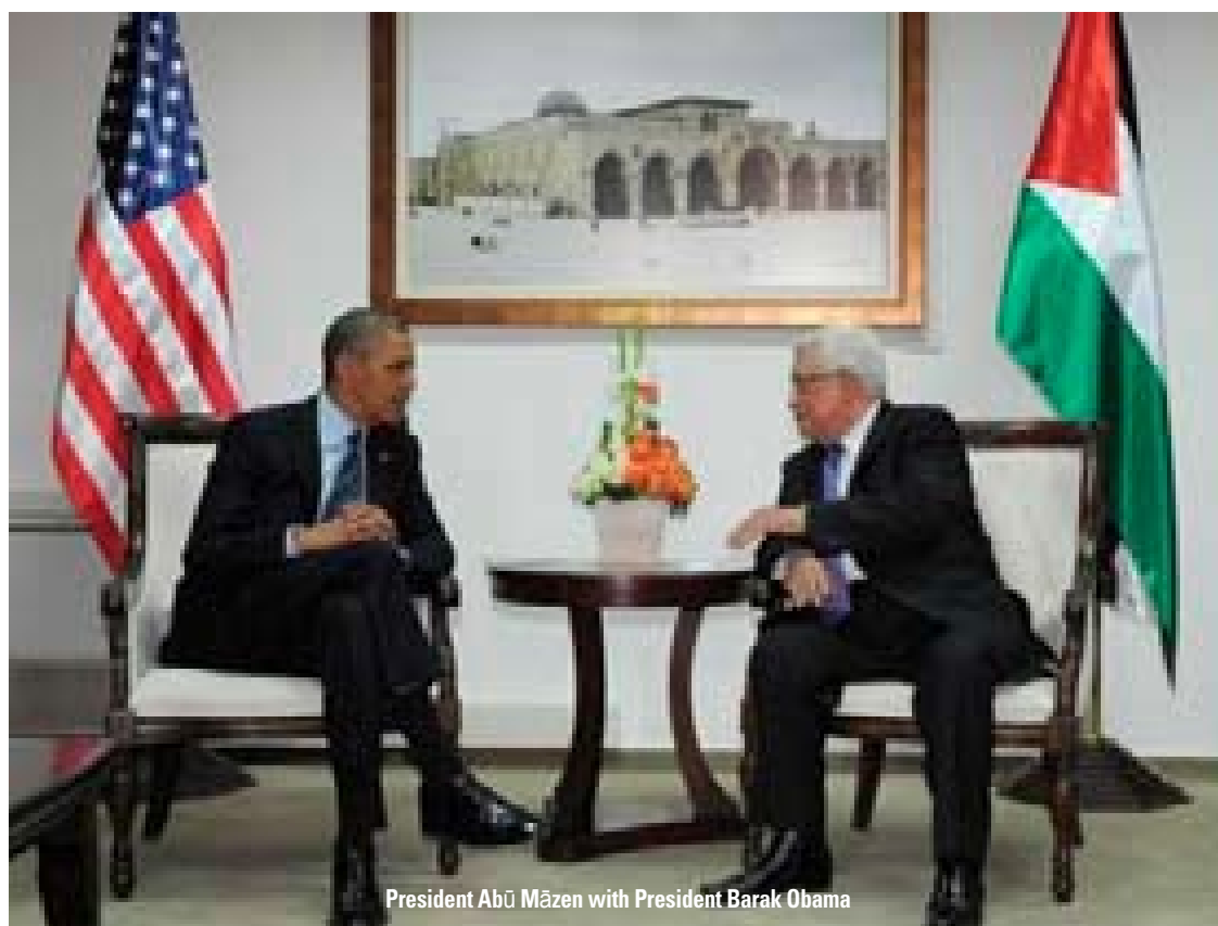
President Abū Māzen with President Barak Obama