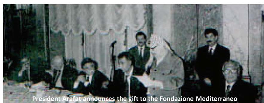
President Arafat announces the gift to the Fondazione Mediterraneo