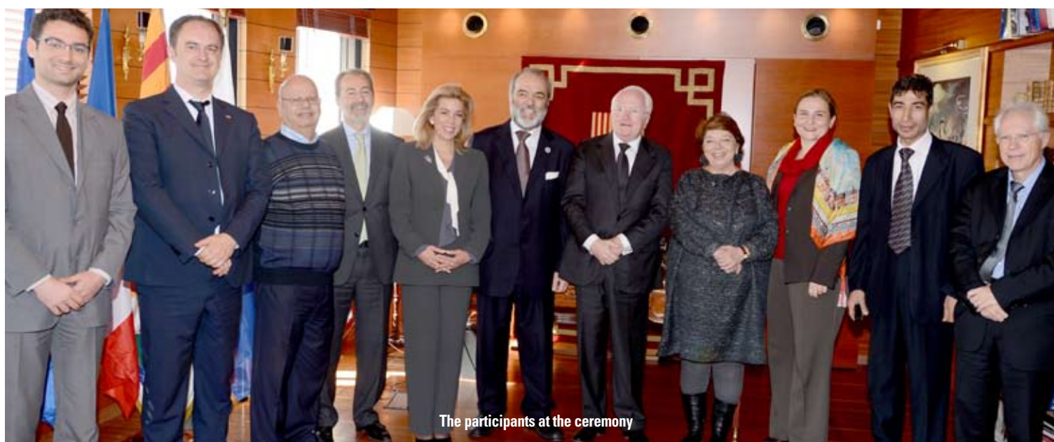
The participants at the ceremony

coincided with events – such as the Anna Lindh Forum, the meeting of young representatives