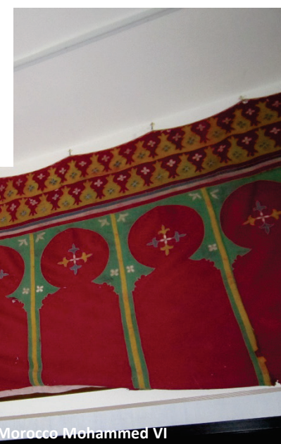
The Mhirab gift of the king of Morocco Mohammed VI