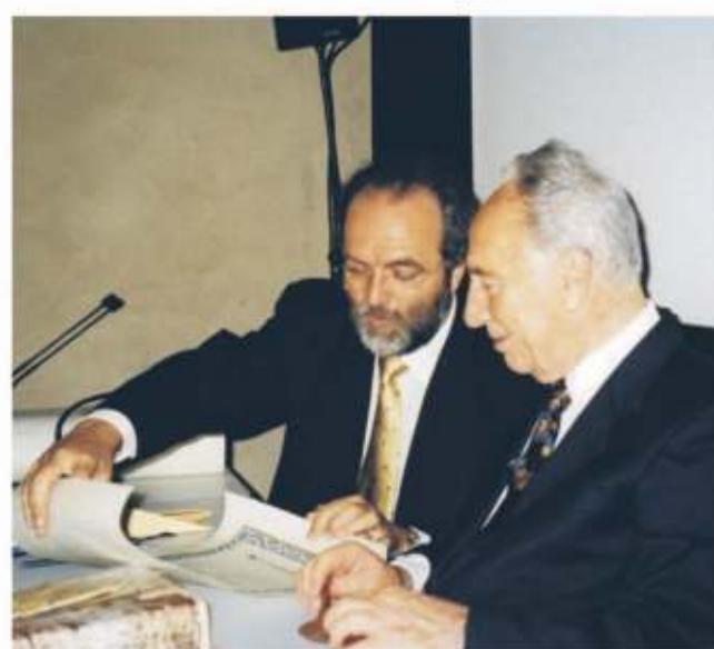
Shimon Peres, presidente di Israele Abu Mazen, presidente della Palestina

Molti protagonisti della storia recente in consessi internazionali significativi hanno affermato che l'azione degli "Stati Uniti del Mondo" ha reso l'IMPOSSIBILE POSSIBILE.