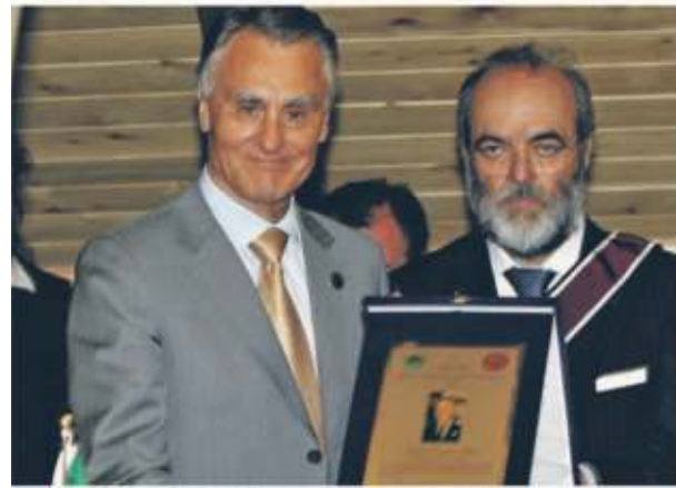
Anibal Cavaco Silva, presidente del Portogallo