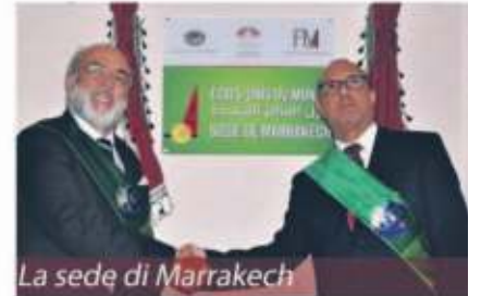
La sede di Marrakech