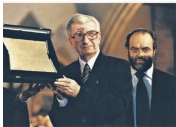
Kiro Gligorov, presidente della Rep. di Macedonia