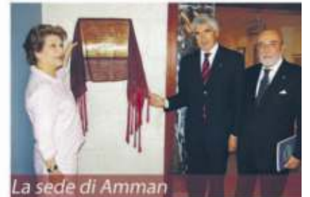
La sede di Amman