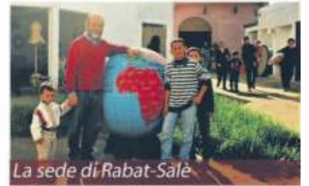
La sede di Rabat-Sale