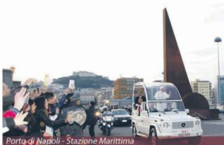
Porto di Napoli - Stazione Marittima

Il simbolo degli "Stati Uniti del Mondo" scelto all'unanimità nel 1997 dai delegati dei vari Paesi è il "Totem della Pace" realizzato dallo scultore torinese Mario Molinari. Da allora è stato realizzato in oltre 90 Paesi. A Napoli, nel Porto di Napoli dinanzi alla Stazione marittima - inaugurata nel 2015 in presenza di Papa Francesco - si trova l'opera monumentale dall'alto valore simbolico: alta 25 metri, contiene l'urna con le reliquie del Migrante Ignoto e, prossimamente, quella con le reliquie delle vittime delle guerre nel mondo.