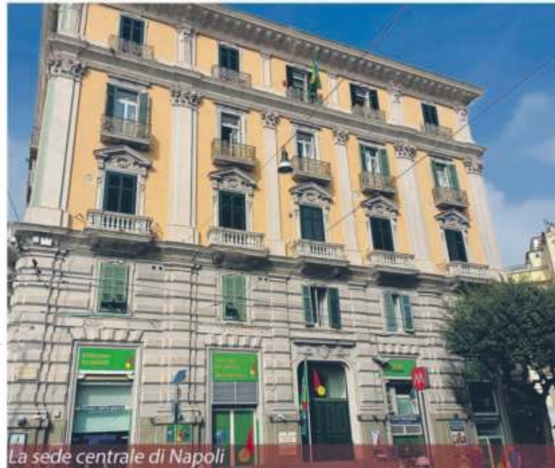
La sede centrale di Napoli

Museo della Pace, patrimonio "emozionale" dell'umanità. Sin dall'anno 2000 sono stati istituiti oltre 200 sedi distaccate e bureaux degli Stati Uniti del Mondo per meglio radicare sui territori il messaggio "Terra e Pace". Tra questi le sedi di Amman, Marrakech, Skopje, Bruxelles, New York, San Paolo, Sidney, Marsiglia, Vienna, Sarajevo ed altre.