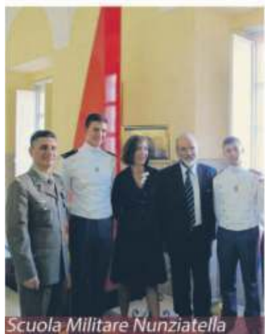
Scuola Militare Nunziatella

IL SIMBOLO &gt; A NAPOLI È PRESENTE NEL PORTO, A PALAZZO SAN GIACOMO E ALLA NUNZIATELLA