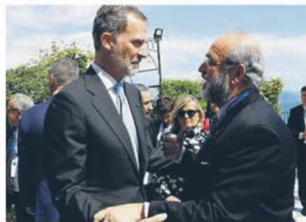
Felipe VI, re di Spagna