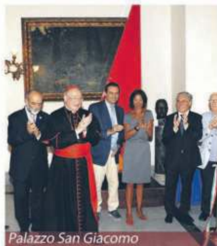
Palazzo San Giacomo