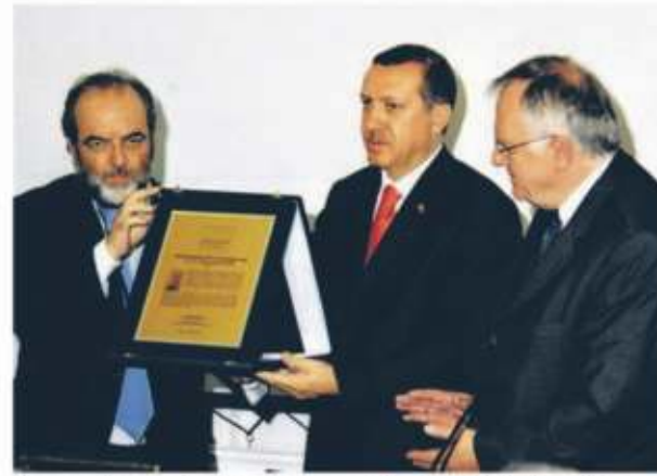
Recep Tayyip Erdogan, presidente della Turchia

Il 18 novembre 2022, a Napoli, i delegati di 181 Paesi e di 16.000 organismi internazionali hanno approvato con atto notarile la "Costituzione degli Stati Uniti del Mondo" contenente i diritti e i doveri degli abitanti del pianeta. Dopo circa 6.000 emendamenti proposti in 37 anni sono stati approvati ed adottati i 45 articoli del testo.