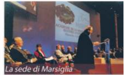
La sede di Marsiglia