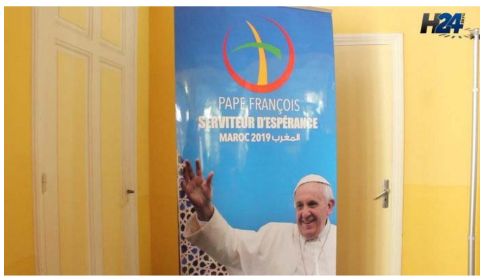
Le pape François sera au Maroc les 30 et 31 mars prochains.