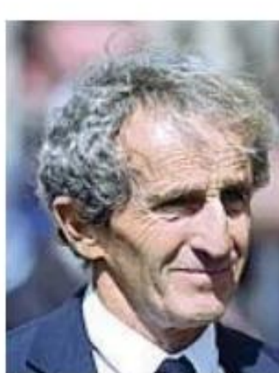
Francesco Alain Prost, ex campione del mondo di Formula 1

M omenti di terrore per Alain Prost, vittima di una violenta rapina nella sua villa di Nyon, sul lago di Ginevra. A darne notizia è stato il quotidiano svizzero Blick secondo cui una banda di malviventi ha fatto irruzione nell'abitazione dell'ex campione del mondo di Formula 1 martedì scorso intorno alle 8.30 di mattina, aggredendo Prost e costringendo uno dei figli ad aprire la cassaforte. L'ex pilota avrebbe riportato un trauma cranico. Non è stato reso noto il valore del bottino, ma si ipotizza che sia molto elevato. La famiglia non ha voluto