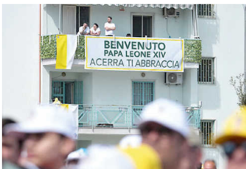
Lo striscione di benvenuto per il Papa