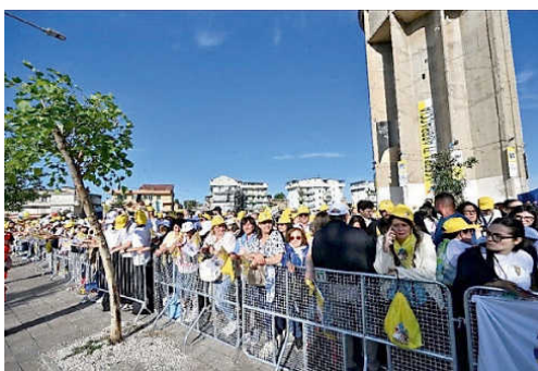
Fedeli in coda ad Acerra

Nell'anniversario della Laudato si' la visita ad Acerra “Raccolgo le lacrime di chi qui ha perso i figli a causa dei rifiuti. Si educi alla cura”