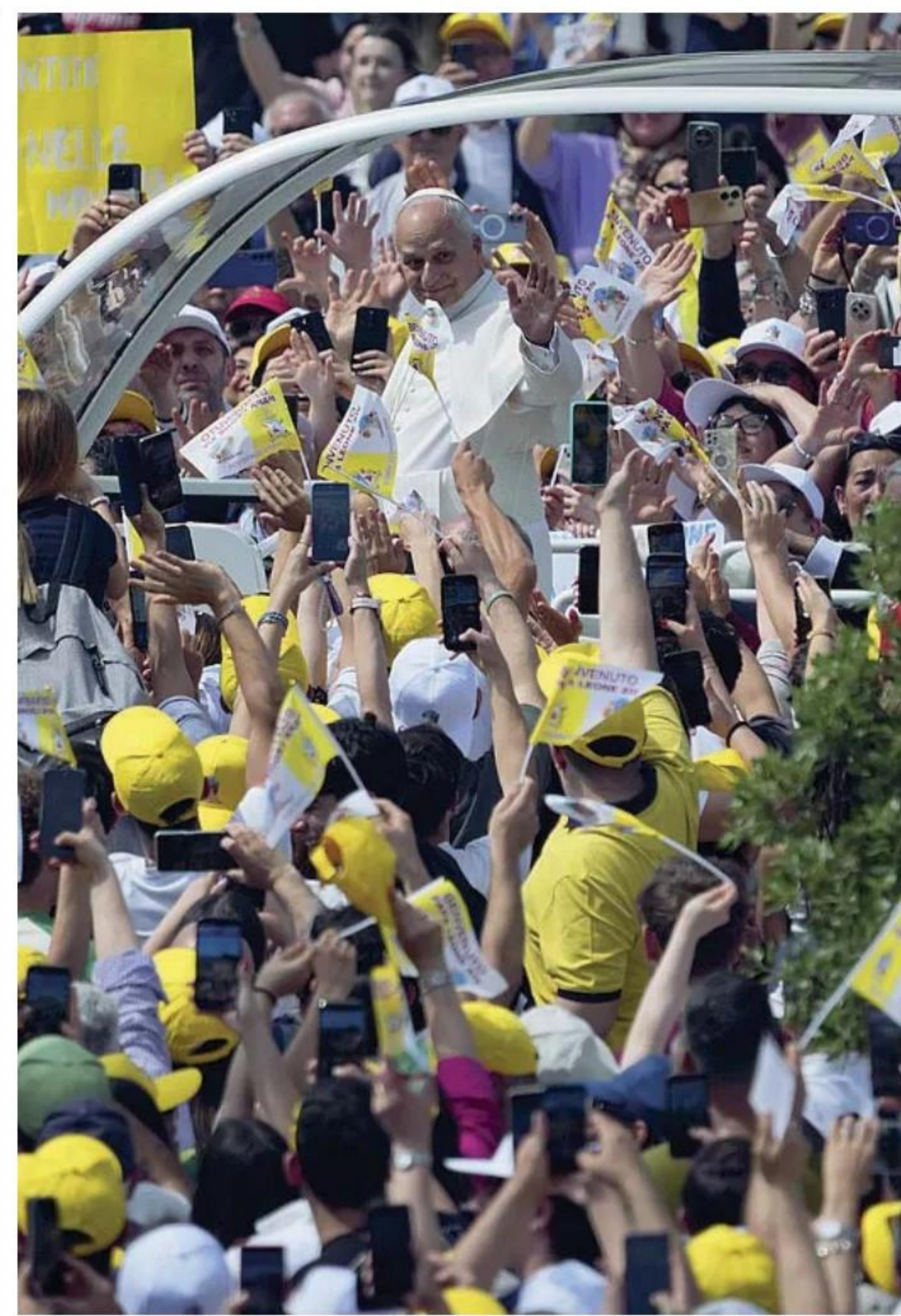
La folla Leone ieri ad Acerra circondato da centinaia di fedeli

Il Papa ne parla più tardi a quindicimila persone in una piazza dominata da una vecchia torre dell'acqua in cemento come i condomini tutt'intorno: «Santità, benedici questa terra» si legge su un lenzuolo appeso. Leone XIV sillaba un discorso rivolto anzitutto alle istituzioni: «