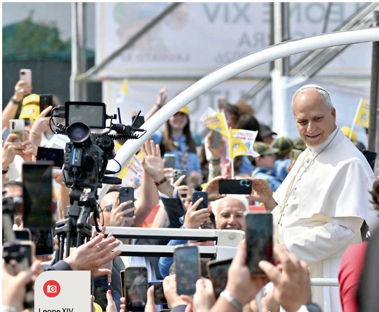
Leone XIV in piazza Calipari ad Acerra: è la prima volta di un Papa nella Terra dei fuochi