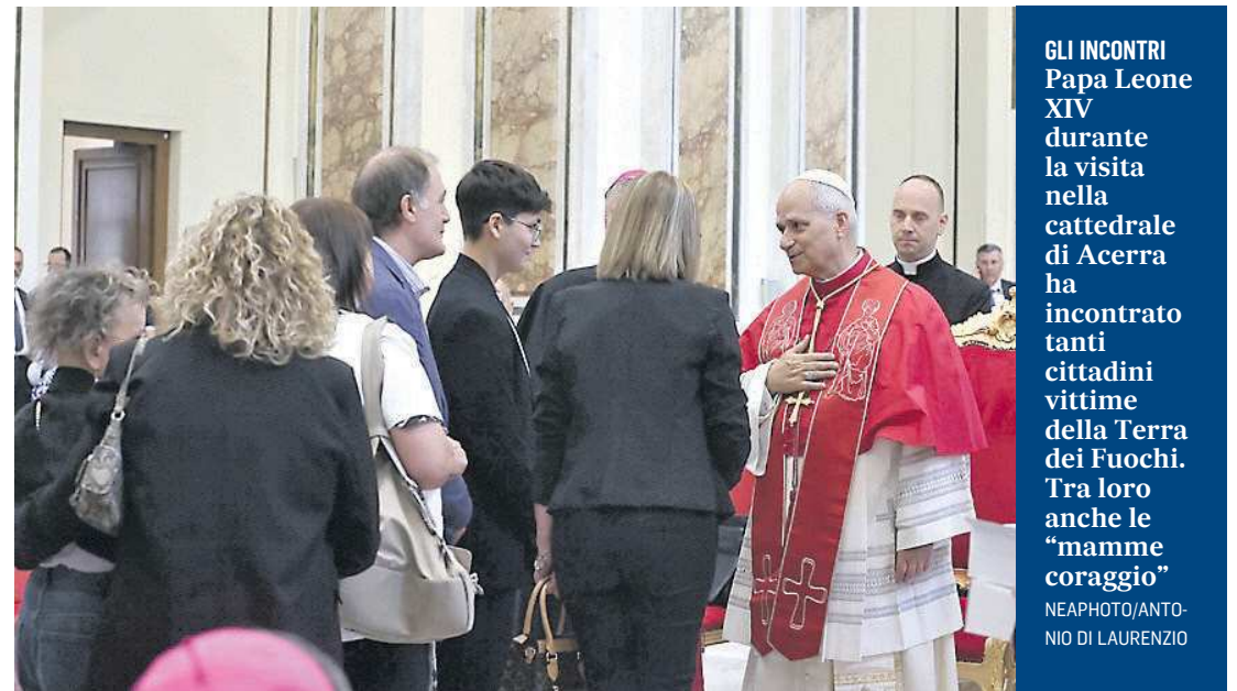
GLI INCONTRI Papa Leone XIV durante la visita nella cattedrale di Acerra ha incontrato tanti cittadini vittime della Terra dei Fuochi. Tra loro anche le «mamme coraggiose»