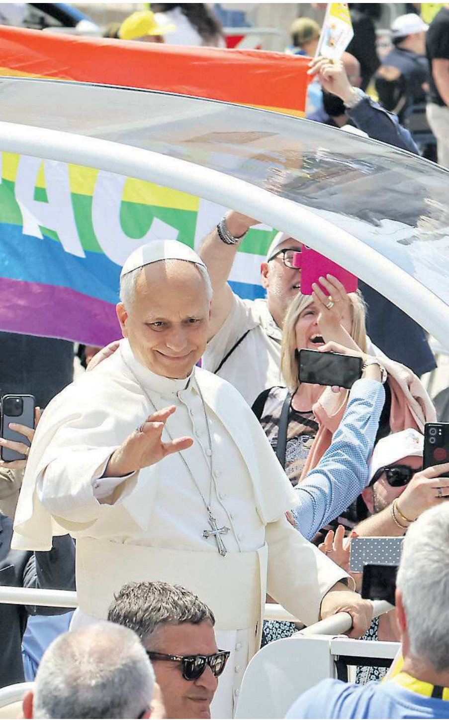
L'abbraccio di Acerra per Leone XIV. A sinistra il Papa con il vescovo Antonio Di Donna

Nel Duomo con i familiari dei tanti morti di cancro: genitori e mogli indossano le magliette con le foto dei loro cari e per ognuno Prevost ha parole di conforto