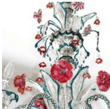
Alcuni dei capolavori dell'arte vetraia di Murano esposti al MAMT.