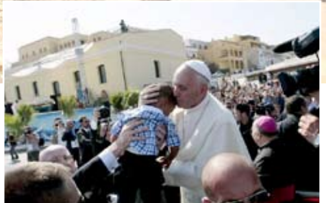
La visita di Papa Francesco a Lampedusa (8 luglio 2013) e le iniziative della Fondazione Mediterraneo per i rifugiati.

I migranti non sono solo un problema per i Paesi d'accoglienza, ma una grande occasione per costituire un grande "meticcio di civiltà". La documentazione ospitata al MAMT – lettere, immagini, video, reper-