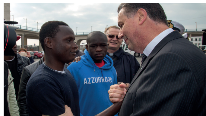
Il Rettor Maggiore Don Angel Fernández Artime abbraccia i giovani migranti.