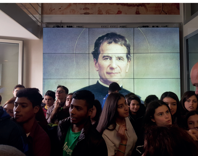
L'Oratorio Salesiano Virtuale del Museo della Pace - MAMT.

Don Ángel Fernández Artime , Rettor Maggiore dei Salesiani di Don Bosco - accompagnato da Don Horacio Lopez e dagli Ambasciatori presso la Santa Sede di Panama, Miroslava Rosas Vargas, e di Guatemala, Alfredo Vàsquez Rivera - ha inaugurato il 17 febbraio 2017 la sezione del Museo della Pace dedicata a " DON BOSCO IL POTERE DELL'AMORE ": dodici percorsi emozionali attraverso i 5 piani del Museo che con video e strumenti ipertestuali trasmettono il carisma di Don Bosco, con momenti essenziali dell'azione che la Famiglia Salesiana svolge in 132 Paesi del mondo: un grande " Oratorio Salesiano Virtuale ".