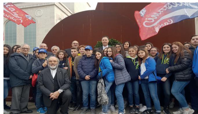
Il Rettor Maggiore Don Angel Fernández Artime con i giovani ed i migranti dinanzi al "Totem della Pace" con le reliquie del Migrante Ignoto.