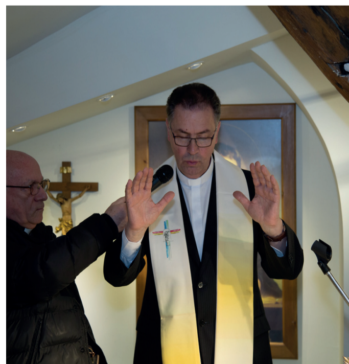
Il Rettor Maggiore dei Salesiani Don Angel Fernández Artime benedica la "Cappella con reliquia di San Giovanni Bosco" del Museo della Pace - MAMT.

Presenti alla cerimonia rappresentanti dei Salesiani dell'Italia meridionale che hanno accompagnato centinaia di giovani e di migranti attraverso i percorsi emozionali ed alla visita nella " Cappella con reliquia di San Giovanni Bosco " e per ultimo al " Totem della Pace con le reliquie del Migrante Ignoto " situato nel Porto di Napoli.