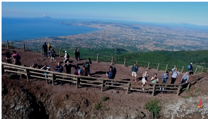
Uno dei video emozionali de "La Campania delle emozioni"

Con i 107 videowall di grandi dimensioni, il Museo ha un sistema di fruizione multimediale con pochi precedenti: