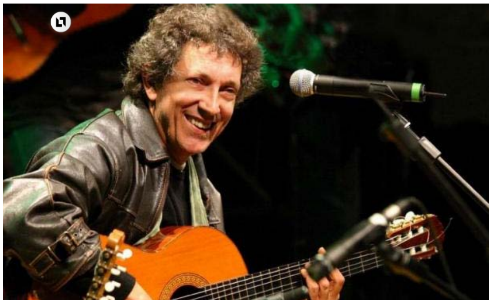
Artista de gira.